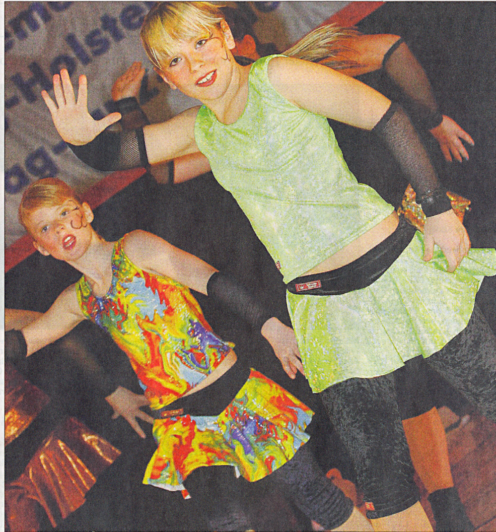
Die Tanzgruppe „Cadence“ vom TSV Uetersen trat in der Kategorie der Acht- bis Elfjährigen für „Zeitgenössische Tanzformen“ an. Die Tänzer glänzten mit Rückwärts-Saltos.

Die „Main Acts“ sehen mit ihren Mützen und Jogginghosen, aus denen die Boxershorts hervorragen, wie