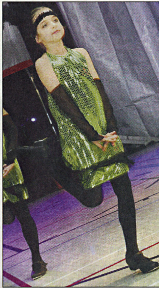
Die Ballettschule Arabesque hat sich für den Bundeswettbewerb qualifiziert.